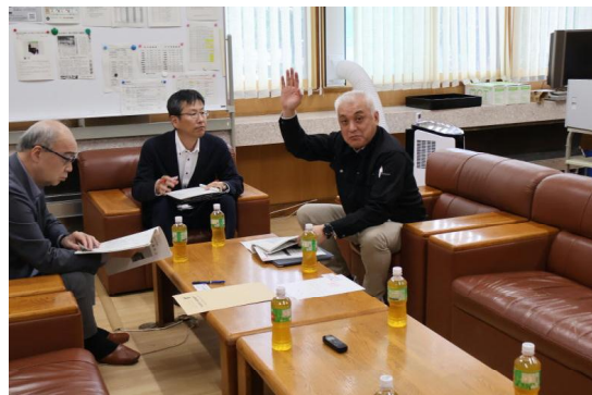
質疑応答・意見交換